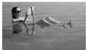
Danes offered sunny holiday for egg donation

Η εν λόγω τράπεζα σπέρματος προτείνει σε Δανέζες να δωρίσουν τα ωάρια τους σε κλινικές Κύπρου, Ελλάδας και Ισπανίας με αντάλλαγμα πολυτελείς διακοπές