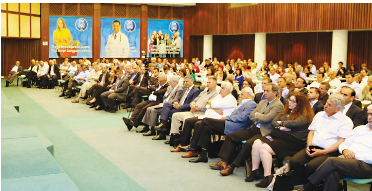
Η ΣΕΚ στην εμπροσθοφυλακή του αγώνα για προάσπιση των δικαιωμάτων των εργαζομένων που τέθηκαν στο στόχαστρο της εργοδοτικής ασυδοσίας