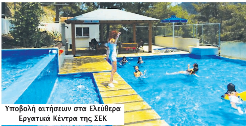
Υποβολή αιτήσεων στα Ελεύθερα Εργατικά Κέντρα της ΣΕΚ

Τα εξοχικά συγκροτήματα που είναι εφάμιλλα ξενοδοχειακών μονάδων, διαθέτουν άνετα και ευρύχωρα διαμερίσματα με όλο τον απαιτούμενο οικιακό εξοπλισμό. Οι υπερσύγχρονες πισίνες που κοσμούν τα συγκροτήματα προσφέρουν δροσιά και ευεξία ενώ τα εστιατόρια με όλες τις σχετικές πιστοποιήσεις ασφάλειας και υγιεινής, προσφέρουν φαγητό σε ελκυστικές τιμές.