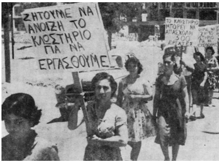
Φωτογραφικὸν στιγμιότυπον ἀπὸ τὴν ἀγωνιστικὴν πινακιδόφορὴν τῶν ἀπολυθεισῶν ἐργατριῶν τοῦ Κοινοτικοῦ Κλωστοῦφαντουργείου.

Σήμερον ἡ ἀντιπροσώπευα τῶν ἀνέργων κλωστοῦφαντουργῶν θὰ συναντηθῇ ἐπὶ τοῦ ἴδιου θέματος μετὰ τοῦ Ἐπιμετροῦ καὶ Βιομηχανίας κ. Ἀραούζου.